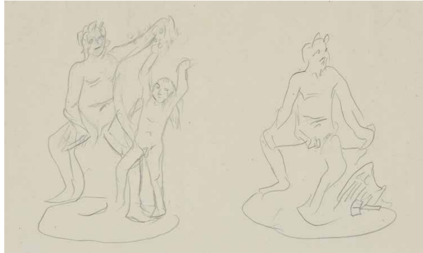
Σάτυρος και Έρωτας και Σάτυρος Μολύβι σε χαρτί, 22,4 x 35,2 εκ.

Πηγή: Ιστοσελίδα Εθνικής Πινακοθήκης, Μουσείο Αλέξανδρου Σούτσου Προσπελάσιμο στον σύνδεσμο: https://www.nationalgallery.gr/artwork/satyros-kai-erotas-kai-satyros/