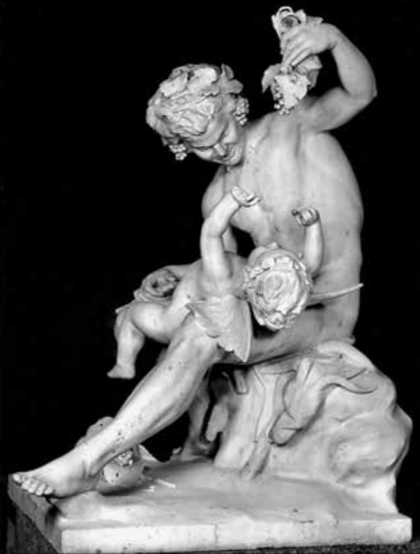
Ο Σάτυρος που παίζει με τον Έρωτα, 1877 Μάρμαρο, 135 x 105 x 73 εκ.